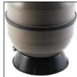
SoCLE circulaire pour une parfaite stabilité du filtre