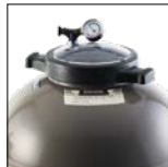
Couvercle Twist Lock pour une ouverture facilitée