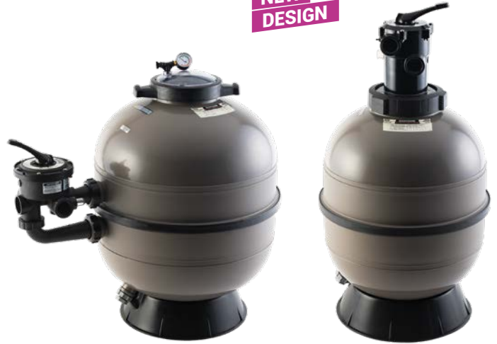
ProSeries™ HI Advanced Side