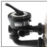
Vanne Vari-Flo™ 6 positions