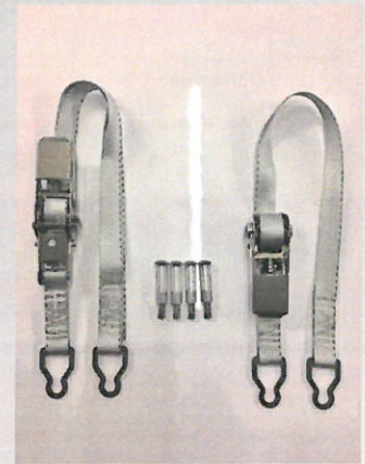
Rem med spännare

Denna produkt minskar risken för skador på ditt poolskydd vid kraftiga vindar.