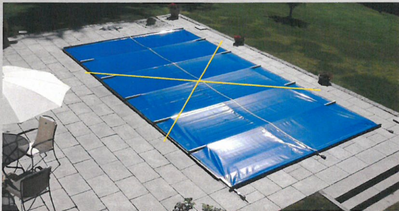
Vindsäkringen monterad (gula på bilden)