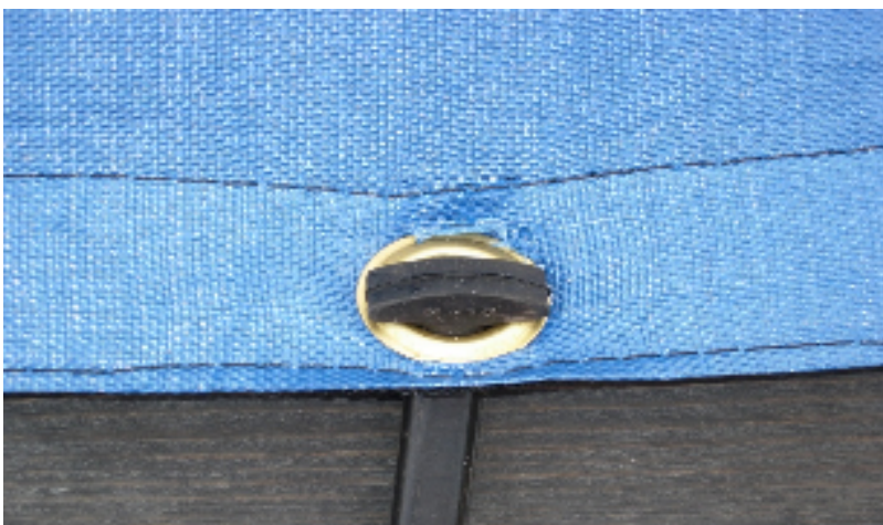
Bild 2, Bilden visar ett felaktigt montage av stropparna. Vid överbelastning vrider sig öljjetten och den skär in i materialet.

OBS! Det vi menar med normal användning av detta överdrag är att man lägger på det och spänner upp ALLA stroppar runt om och spänner ”lagom” hårt. Det får gärna hänga lite slackt och vila på vattenytan. - Detta överdrag klarar en belastning av en vuxen person, det kan dock hända att den blåa väven fransar sig lite vid öljjetten om man skulle råka ramla ut på överdraget, det har ingen betydelse för hållfastheten då det finns ett förstärkningsband påsytt. Det är endast ämnat att användas på sommaren. (för vintertäckning används täckplåt eller vinteröverdrag).