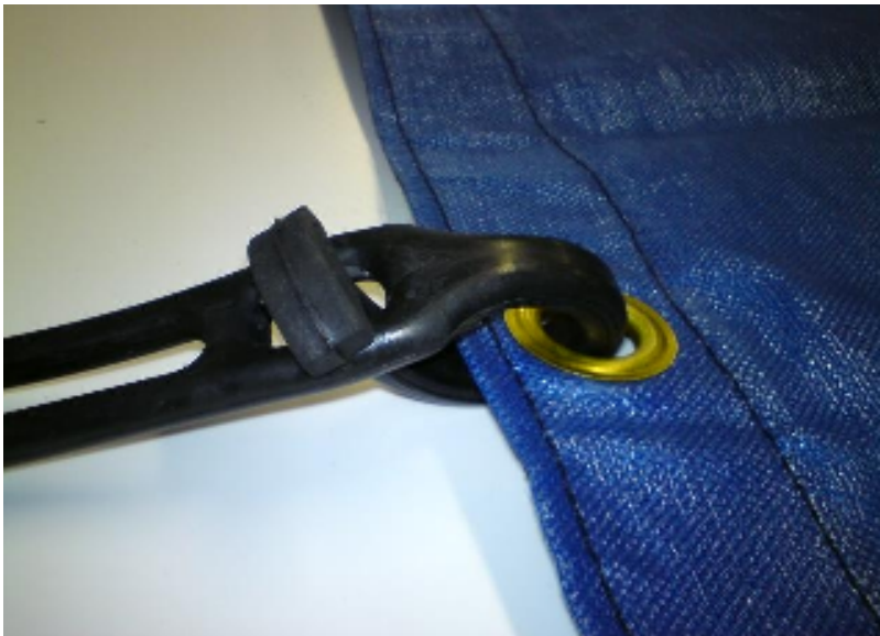
Bild 1, Bilden visar en riktig montering av stropparna. Det är viktigt att ALLA stroppar sätts fast då täcket är på. Om bara några få stroppar sitter fast uppstår ökad belastning på öljetterna likt bilden nedan.